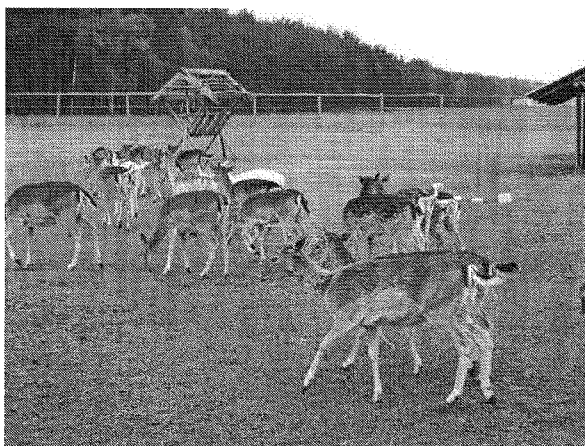
Zdj. Ferma danieli w Gościnowie

Kolejną atrakcją turystyczną są zlokalizowane na terenie sołectwa pomniki przyrody: