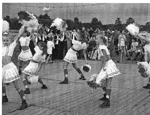
Plac rekreacyjno-sportowy w Gościnowie

Przez wieś przebiega projektowany ponadregionalny szlak rowerowy, który umożliwia zwiedzanie większości ciekawych krajobrazowo terenów. Zielony szlak rowerowy prowadzi przez kilka miejscowości : Lubiaków, Wiejce, Krobielewko, Skrzynice, Nowy Dwór, Świniary, Skwierzynę, Nowe Dłusko-dalszy przebieg szlaku przez gminy: Przytoczna, Pszczew i Trzciel). Jest to szlak o długości 39,70 km.