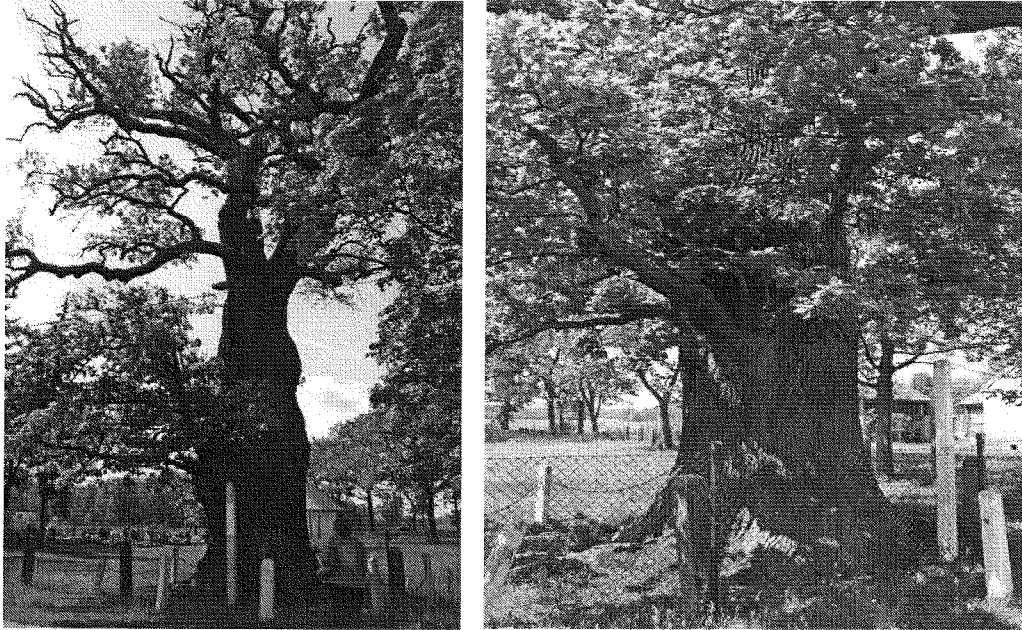
Zdj. Pomnikowy dąb na cmentarzu w Gościńowie

W Gościńowie znajduje się kilka działek pod zabudowę mieszkaniową oraz szereg ciekawych nieruchomości do rozwoju agroturystyki i turystyki wiejskiej. Na terenie wsi nie ma zakładów przemysłowych, które by powodowały zanieczyszczenie środowiska naturalnego.