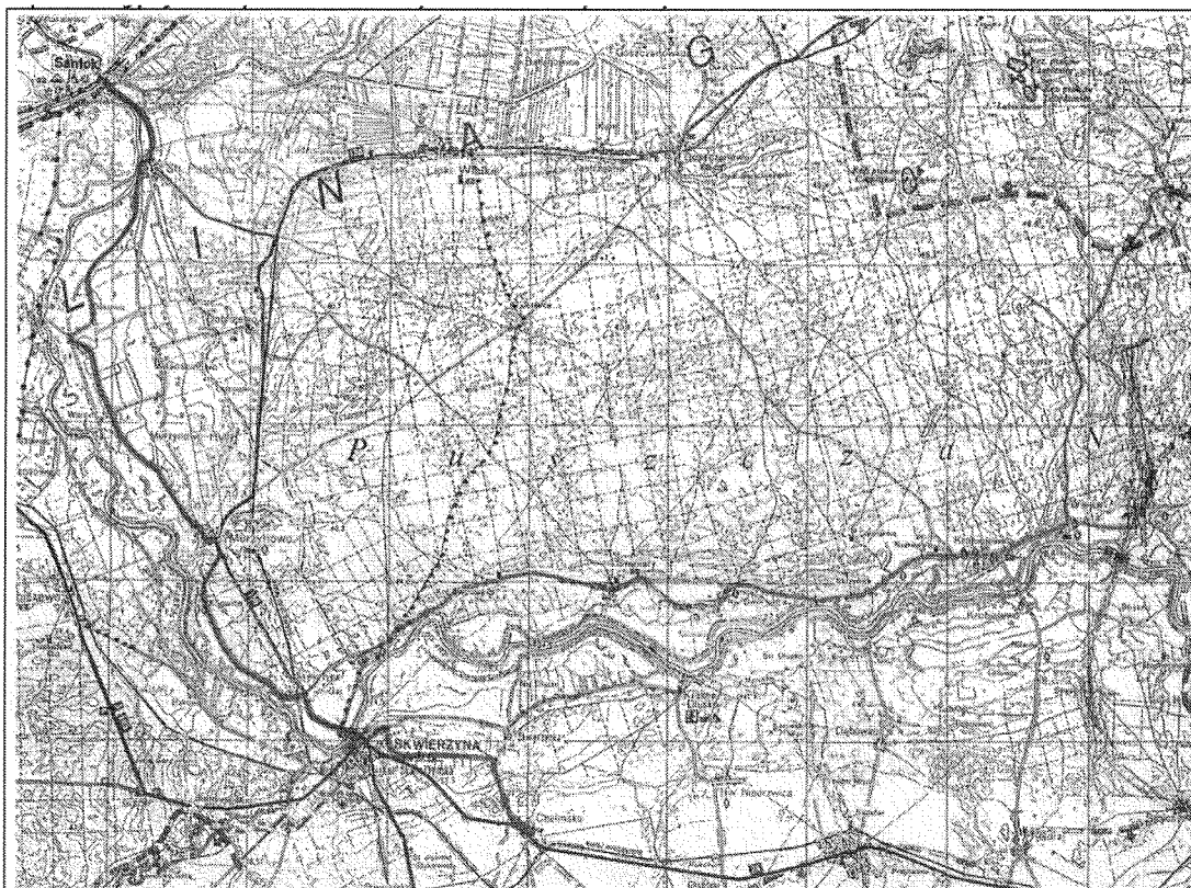
Zdj. Planowany szlak rowerowy – widoczne możliwe włączenie miejscowości Gościno

Dla realizacji zadania istotny jest fakt, iż planowana budowa euroregionalnego szlaku rowerowego (projektowany czerwony) stworzy możliwość przyłączenia miejscowości do wspólnego szlaku Santok- Stare Polichno-Gościno-Warcin-Murzynowo- Kijewie-Skwierzyna- Chełmsko ( dalej przez Twierdzielewo, Rojewo, Głębokie do Międzyrzecza). Inwestycja zakłada zakup i montaż tabliczek, drogowskazów oraz tablicy informacyjnej. Realizacja zadania wpłynie korzystnie przede wszystkim na poprawę atrakcyjności turystycznej miejscowości i całej gminy.