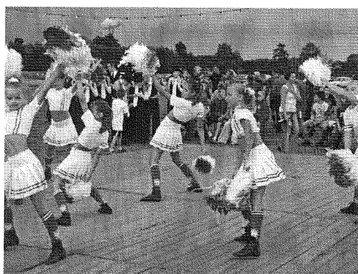
Plac rekreacyjno-sportowy w Gościnowie

Przez wieś przebiega projektowany ponadregionalny szlak rowerowy, który umożliwia zwiedzanie większości ciekawych krajobrazowo terenów. Zielony szlak rowerowy prowadzi przez kilka miejscowości : Lubiaków, Wiejce, Krobielewko, Skrzynice, Nowy Dwór, Świniary, Skwierzynę, Nowe Dłusko-dalszy przebieg szlaku przez gminy: Przytoczna, Pszczew i Trzciel). Jest to szlak o długości 39,70 km.