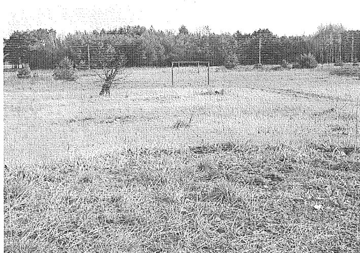
Zdj. Miejsce lokalizacji placu zabaw i boiska sportowego

Projekt : Zagospodarowanie terenu wokół świetlicy na plac zabaw dla najmłodszych mieszkańców wsi