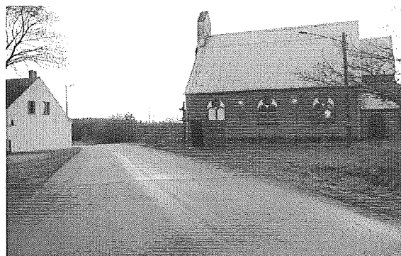
Zdj. Świetlica wiejska w miejscowości Dobrojewo

Remont świetlicy umożliwi powstanie lokalu, w którym będą mogli spotykać się mieszkańcy wsi, przede wszystkim dzieci i młodzież; pozwoli na organizowanie imprez, festynów wiejskich, pobudzi do aktywniejszego uczestnictwa w przedsięwzięciach kulturalnych mieszkańców wsi.